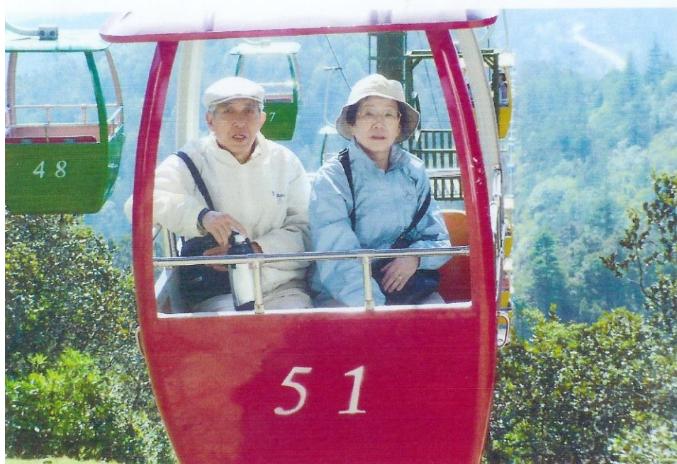
2006-08-04 09-41-37 云南丽江玉龙雪山牦牛坪 海拔3600米

辺境で出会った「電腦快照」は雲南省の玉竜雪山（標高5596M）の麓から一気に1000メートルを25分で上るロープウェーで、終点3360Mの大草原に着いた途端にデジカメで撮って、即プリントアウトしてくれる記念写真のクイックサービスがあった。（1枚10元＝¥150）